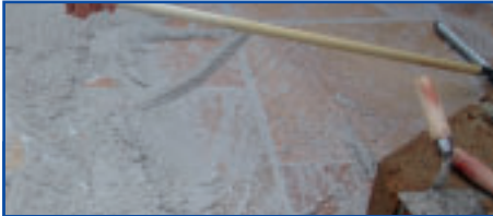
Ausfugen mit drainfähigem Epoxidharz-Fugmaterial

Flecken durch aufsteigende Feuchtigkeit können durch "Rundum-Imprägnierung" vor dem Verlegen reduziert werden. Voraussetzung für dieses Verfahren ist, dass die Steinplatten trocken und sauber sind und in Splitt verlegt werden. Das allseitige Auftragen auf die Platte erfolgt durch Tauchen (ca. 30 Sekunden) oder Einstreichen mit einer Rolle oder einem Pinsel oder Einsprühen. Vom Material nicht aufgenommenes Produkt muss vor dem Trocknen abgewischt werden. Vor dem Verlegen oberflächlich abtrocknen lassen, da bei Verlegung im nassen Zustand ein Wirkungsverlust eintreten kann.