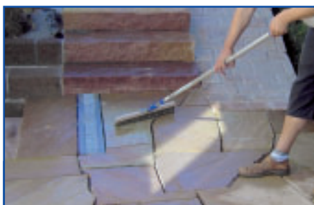
Lithofin FLECKSTOP >W< gleichmäßig verteilen

Lithofin FLECKSTOP >W< satt und gleichmäßig auf die gesamte Fläche auftragen, bei Absätzen und Treppen müssen auch senkrechten Flächen behandelt werden.