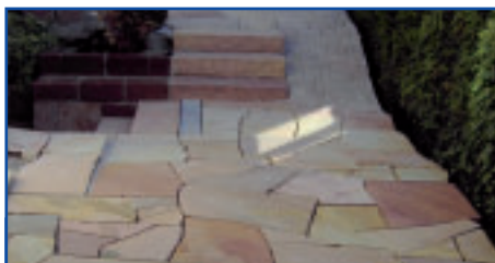
Die Fläche muss nach den Regeln der Technik verlegt und sauber und trocken sein.