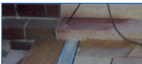
Auch senkrechte Flächen behandeln

Kehren Sie lose Verunreinigungen (Sand, Laub etc) mit einem harten Besen ab. Hartnäckige Flecken mit speziellen Reinigern entsprechend der Lithofin-Anwendungstabelle beseitigen. Nach dem Reinigen, die Fläche wieder gut trocknen lassen.