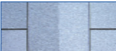
Mit Lithofin Resin-EX entfernt man Reste von Epoxy-Fugenmörtel

Die erforderliche Flankenhaftung bleibt in ausreichendem Maße erhalten. Messungen haben gezeigt, dass die Flankenhaftung bis zu 90 % erhalten bleibt. Voraussetzung dafür ist jedoch, dass Lithofin FLECKSTOP >W< gemäß Verarbeitungsvorschrift aufgetragen wird. Weiterhin ist entscheidend dass die Ausführung des Unterbaus den Regeln der Technik entspricht.